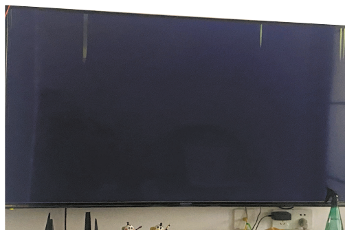
▲ 包先生家的挂墙电视机突然黑屏,什么节目都看不见了 ▶ 夏普维修网点开具的维修单写明“外力所引起(的)漏液不予保修”

包先生报修后,夏普品牌维修人员上门检查电视机,判定为机器漏液,在维修表上将损坏原因记录为“外力可引起的故障”,并以此为由不予保修。当场,包先生拒绝签字确认。“是不是损坏原因只要是‘外力可引起的故障’,就能将电视机质量问题归咎于消费者使用不当原因造成?既然是外力引起,为何电视机表面又毫无外力痕迹?维修人员不能举证是消费者原因,就能拒保?”包先生强调,当时,维修人员并没有检查出屏幕上有没有裂缝或磕碰。到底是电视机质量存在缺陷,还是消费者使用不当原因造成,并没有任何鉴定。因此,他无法认同这一“拒保”