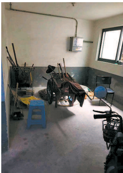
■ 地下非机动车停车库沦为“杂物间”

记者来到该小区实地采访。据业主介绍,莲花河畔景苑小区设有3个大型地下非机动车停车库,总共能够停放超过500辆非机动车,基本能满足整个小区居民的停车需求。其中一个就位于18号楼的地下一层。记者走进该车库后,映入眼帘的却是多个废弃的花箱,还有扫帚和桌椅等废旧物品堆成的“小山”。这些陈年旧物的表面都覆盖着一层厚厚的灰尘,记者即便戴着口罩,也依旧难抵地下室里堆放的杂物散发的阵阵霉味。