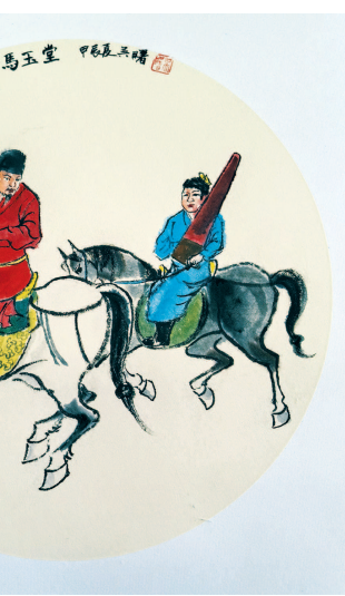
金马玉堂 (中国画) 吴曷

的婚房亭子间格外青睐,他们时不时来寒舍小坐,话题离不开“亭子间的文化现象”。鲁迅在亭子间写过许多文章,其中就有著名的《且介亭杂文》,“租界”其半曰“且介”,遂叫“且介亭”。1933年,瞿秋白也在东照里12号亭子间住过,住在附近大陆新村的他,鲁迅几乎每天去看他,那个年代,还出现不少描写亭子间生活的文学作品,如郭沫若的《亭子间中》、梁实秋的《亭子间生涯》、周天籟的《亭子间嫂嫂》。同学们说,希望坐拥亭子间的我,也能沾些亭子间的仙气,写点东西来。