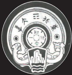
林徽因设计的东北大学校徽