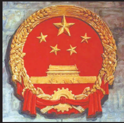
林徽因参与设计的国徽