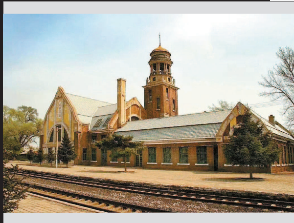
林徽因设计的吉林火车站西站