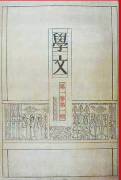
林徽因设计的报纸和杂志