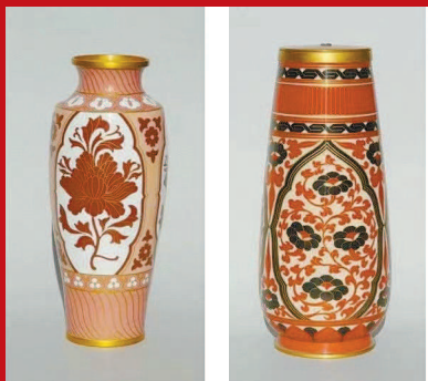
林徽因参与设计的景泰蓝