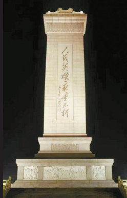
林徽因参与设计的人民英雄纪念碑