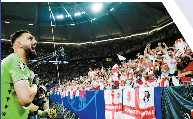
格鲁吉亚门将马马尔达什维利与球迷庆祝晋级