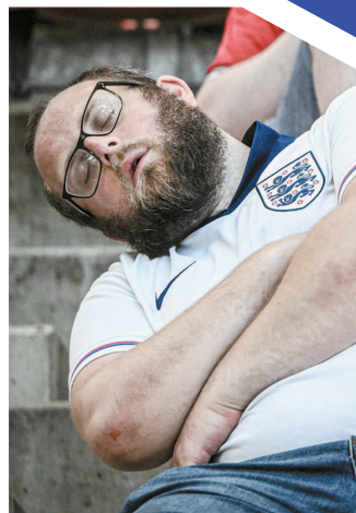
英格兰球迷哈恩在看台上睡着了

欧锦赛进入间歇,晋级淘汰赛的诸强回到驻地短暂休整,为明天开始的淘汰赛厉兵秣马。球场内暂时不见硝烟,不过球场外依然有别样的精彩。除了受人关注的球星,欧锦赛至今,球迷的喜怒哀乐,也成了赛事的热门话题之一,更构筑了一道属于足球的别样风景线。