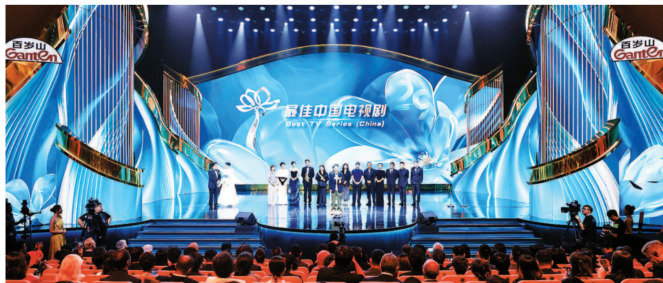
■ 白玉兰奖昨晚揭晓,电视剧《繁花》荣获最佳中国电视剧奖

6月28日,第29届上海电视节白玉兰奖颁奖典礼在上海临港演艺中心举行,这也是“白玉兰绽放”颁奖典礼首次走出中心城区举办。上海出品的电视剧《繁花》荣获最佳中国电视剧、最佳男主角、最佳编剧(改编)、最佳摄影、最佳美术等5个奖项。《漫长的季节》导演辛爽获最佳导演。上海出品的纪录片《何以中国》获最佳系列纪录片。动画片《中国奇谭》获国际传播奖。至此,本届上海电视节圆满落幕。 >>>详见第10版