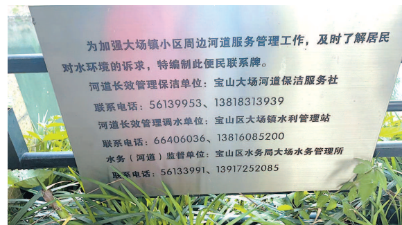
▲ 河道信息公示牌 ▲ 泵站放江，河水黑臭