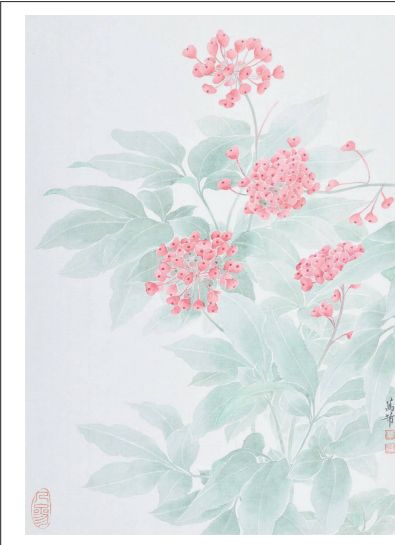
《本草纲目》百幅中药材之人参(纸本设色)万蒂

黄兴路北段从走马塘到江湾五角场的空间,讲述上海城市发展的第二个时代的故事(1912—1949)。1922年孙中山提出要把上海建设成为世界商港城市,1927年上海成为特别市之后提出大上海计划,要在租界之外的江湾五角场建设上海自己的市中心,与租界开展竞争。同济大学毕业后留德回国的博士沈怡担任工务局长,主持了这个大上海自主建设国际大都市的宏大项目。大上海计划的实施因为日本人人侵而中止。现在留下的印记可以分为大小两个空间。小空间是在淞沪路以东和翔殷路以北建设的上海行政中心,标志性建筑是市政府大楼、市图书馆、市博物馆、江湾体育场等。市政府大楼周围建设了十字形