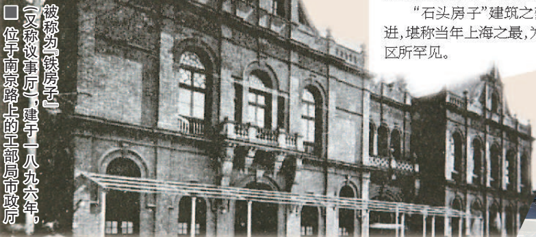
■ 被称为“铁房子”的工部局议事厅,建于1896年,位于南京路上的工部局市政厅

1928年10月,“铁房子”被以130万两出售。1929年拆除后,在原址上建起了新雅粤菜馆。