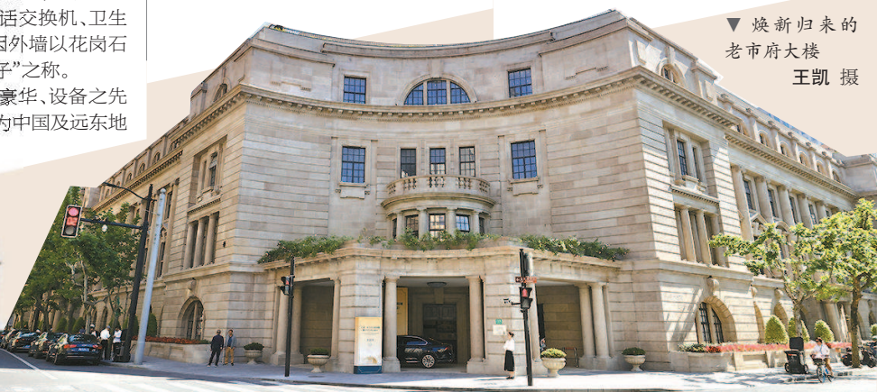
▼ 焕新归来的老市府大楼