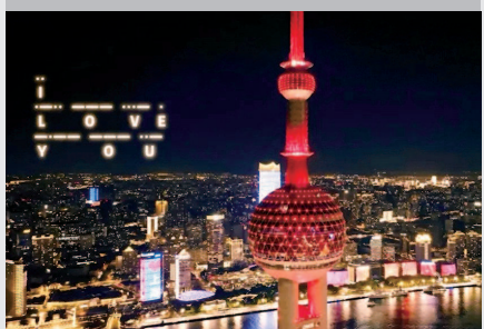
▲ “东方明珠”以灯光“发送”摩斯密码“我爱你”

上海的红色文创，在历史与现实的同频“共振”中，在赓续与接力中，始终保持与生活对话、与潮流对话，坚持打磨创意和迭代升级并举，以追求极致、讲究品位的精细绣花功夫，打破设计边界，成为上海市民精神文化生活中不可多得的陪伴者、引领者。