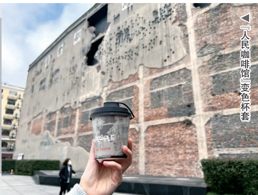
▲ 人民咖啡馆“变色杯套”