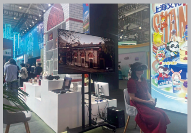
▲ “初心之旅”行进式VR党课