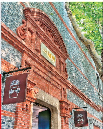
▲ 中共一大纪念馆对面的“一咖啡”