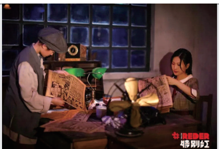
▲ 为四行仓库量身打造的沉浸式戏剧《秘密》