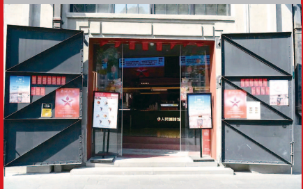
▲ 四行仓库附近的“人民咖啡馆”