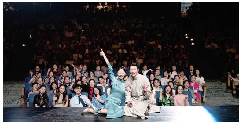
▲ 舞剧电影《永不消逝的电波》演员与观众