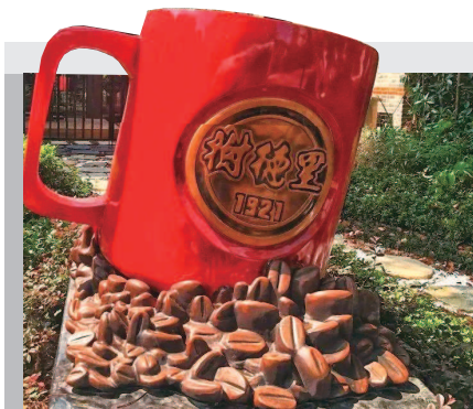
▲ 一大文创“树德里”马克杯