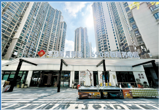
半马苏河驿站·一六九零党群服务中心

位为“烟火日常”形态，集结了便民惠民生鲜店、街头老字号以方便周边居民日常生活。沿街区域则定位为“日咖夜酒”形态，引入精品咖啡馆、小酒馆、精致餐饮等符合年轻人喜爱的业态，为追求潮流生活的群体提供丰富体验。同时，开展“半马苏河·光明生活节”，与6个普陀苏州河畔知名文旅地标和超过130个青年创意特色品牌联动，推动一刻钟生活便民圈生态发展，构筑市民对城市社区生活的美好想象。