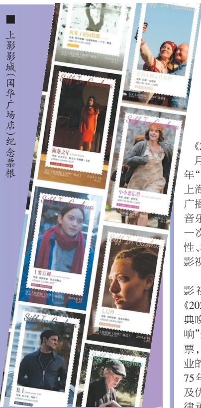
■ 上影影城(国华广场店)纪念票根

不少影院除了提供餐饮服务,还主动想影迷所想,为影迷营造观影仪式感。像上海百丽宫旗下影城(百丽宫、百美汇、MOVIE MOVIE),不仅推出了包含购票方式、交通方式、影院排片表等有用信息在内的“全攻略”,免费提供水、湿纸巾等观影“补给”,还制作了丰富的观影衍生品——有1:1还原电影节票根尺寸的“影院纪念票根”,凭两张旗下影院的电影展映票根即可免费领取。美琪大戏院、FANCL艺术中心(艺海剧院)、兰心大戏院等剧场型影院,在本届电影节期间安排了纪念物料供影迷领取。兰心大戏院则在10天的电影节期间,每天推出一期《兰心十日谈》,刊登兰心大戏院历史旧闻与当日影讯,影迷可以凭兰心大戏院当日场次影票领取。 本报记者 孙佳音