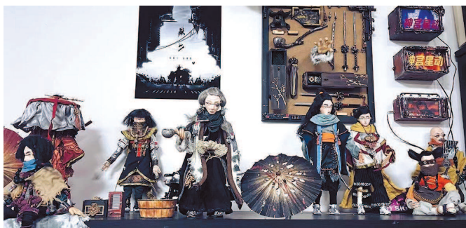
动画单元提名短片《无二》定格

“古典文学”和“民族传说”两个主题。“古典文学”主题,包括上美影“遗珠”系列动画中改编自《聊斋志异》《三国演义》《水浒传》等名著的《崂山道士》《曹冲称象》《真假李逵》等名作,以及年轻创作者以多彩视觉风格进行现代演绎的《无二》《麦城》等影片。“民族传说”主题,包括上美影“遗珠”系列动画中取材自白族、壮族、傣族等民族文化的《蝴蝶泉》《一幅僮锦》《孔雀公主》等作品,还有充满时代气息的《荆棘鸟》。此外,本次展映活动中,观众还能看到《张飞审瓜》《人参娃娃》《高女人和矮丈夫》《十二只蚊子和五个人》《新装的门铃》《漠风》《安宁》《瓷娃娃》