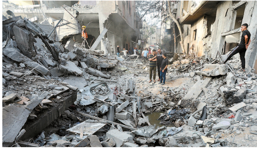
以军空袭后的加沙地带努赛赖特难民营

哈马斯10日也发表声明对安理会通过决议表示欢迎,并表示愿意与调解方合作,就执行符合加沙人民和哈马斯要求的原则进行间接谈判。