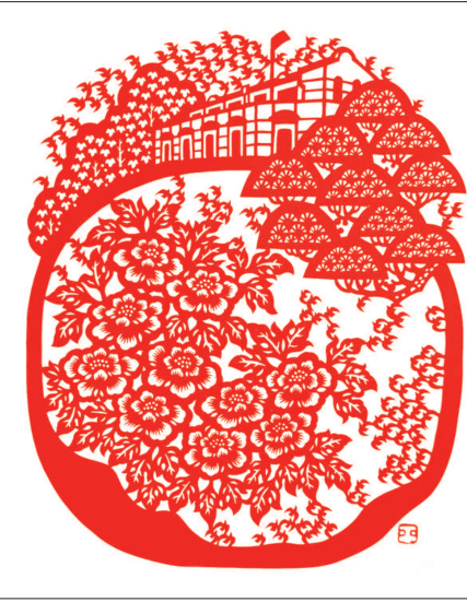
百年会址展新颜(剪纸) 孙平

个同学的孩子一次高考,超出最后进场时间1分钟,被拒之门外,阻断他一段人生路程的不是那扇铁门,是生峻的时间。