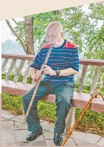
黄永玉在回廊悠闲吹箫