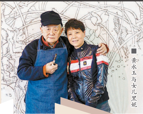
黄永玉与女儿黑妮