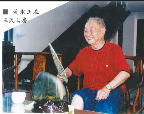
黄永玉在玉氏山房