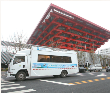
首张TD-LTE规模演示网亮相世博

六届进博会以来，上海移动采用多项新技术新能力，助力进博会“越办越好”，一张不断升级的“会呼吸、能思考、更绿色”的“七双”网络成为重大通信保障任务中的“标配”。