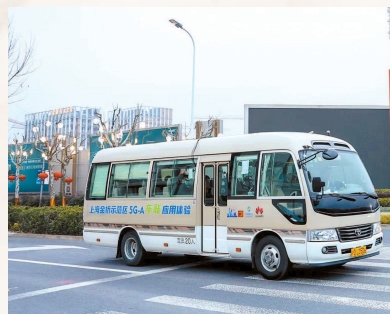
建成首条5G-A车联网示范路线