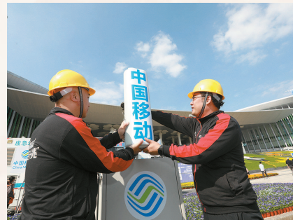
综合信息服务全力保障历届进博会