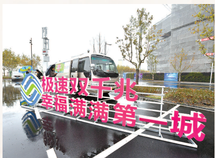
助力建成“双千兆第一城”