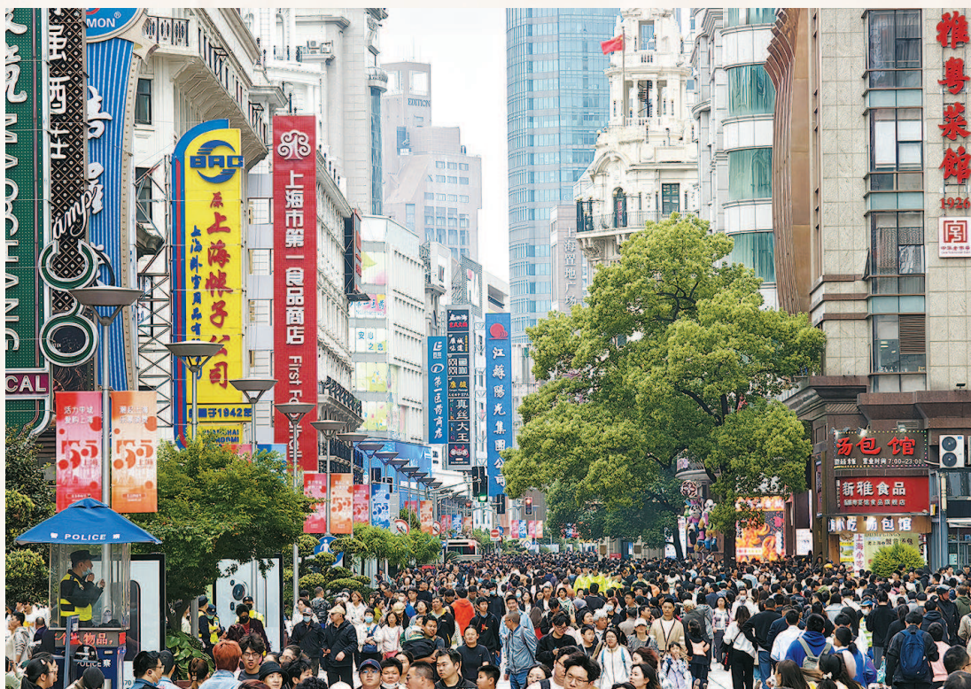
如今，南京路步行街人流如织，一派热闹繁华景象