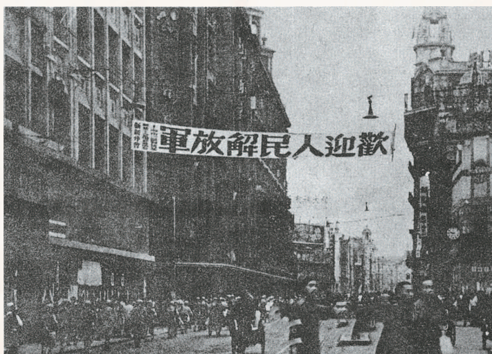
七十五年前的南京路挂出欢迎人民解放军的横幅