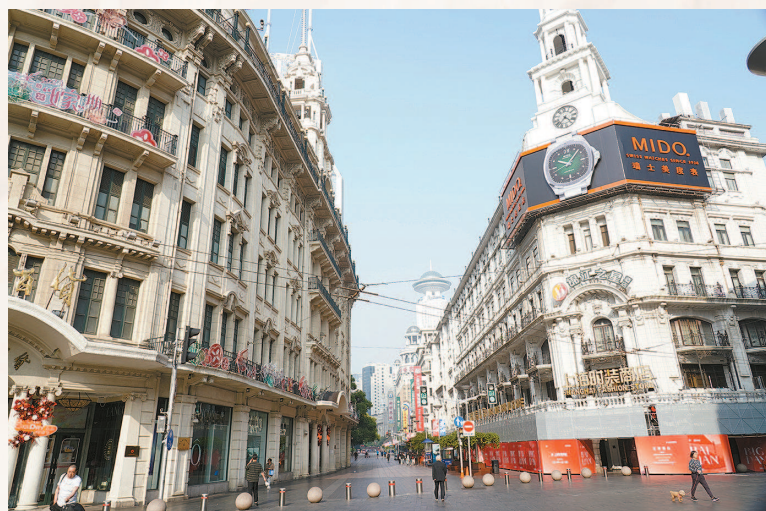
七十五年后的南京路，清晨，静待八方游客