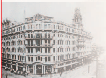
以前的永安公司和绮云阁