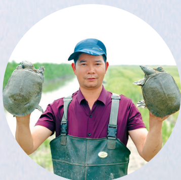
■ 专业养殖人员展示横沙新洲生态甲鱼

江海交汇,农田广袤,候鸟啁啾,远离喧嚣……如果不是亲眼所见,你很难想象,上海至今仍保留着一片极为珍贵的“世外桃源”。这里是万里长江的最东端——崇明横沙岛。在这片自然净土中,上海现代农业产业园(横沙新洲)规划诞生,将成为世界级现代都市生态绿色农业示范区。