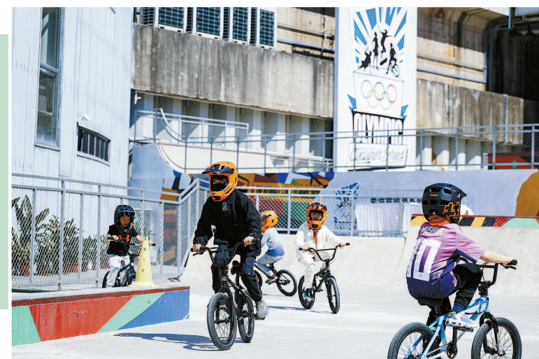
在运动启蒙区, 小朋友们正在体验小轮车运动