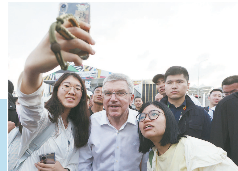
观众争相与国际奥委会主席巴赫合影