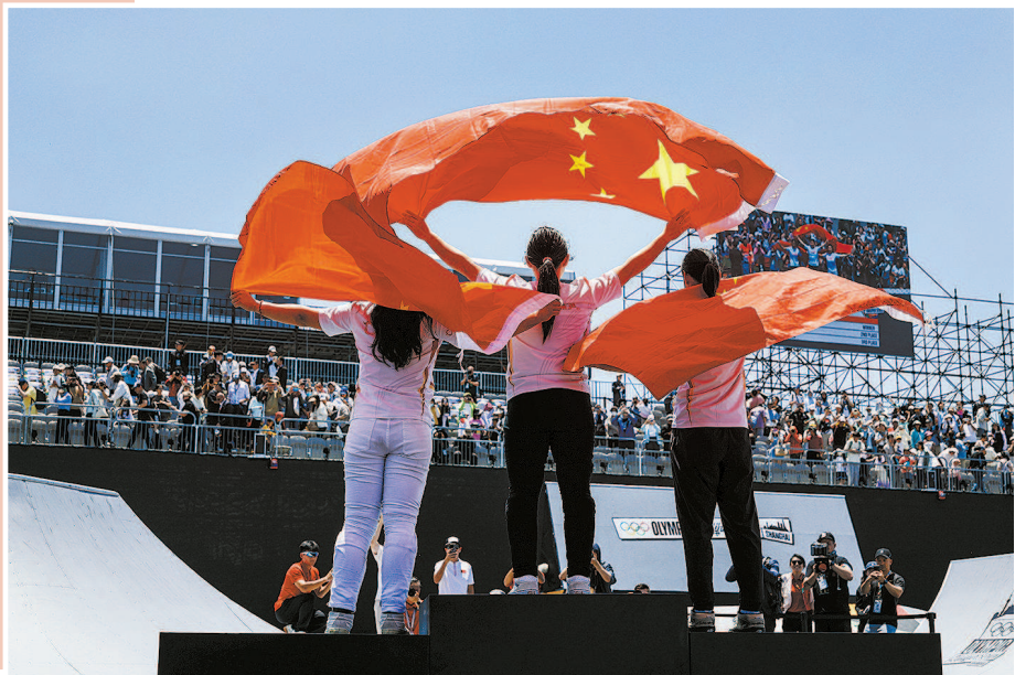
中国女子自由式小轮车选手包揽比赛前三名