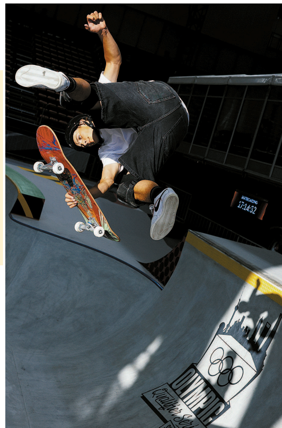
选手在阳光下演绎速度与激情