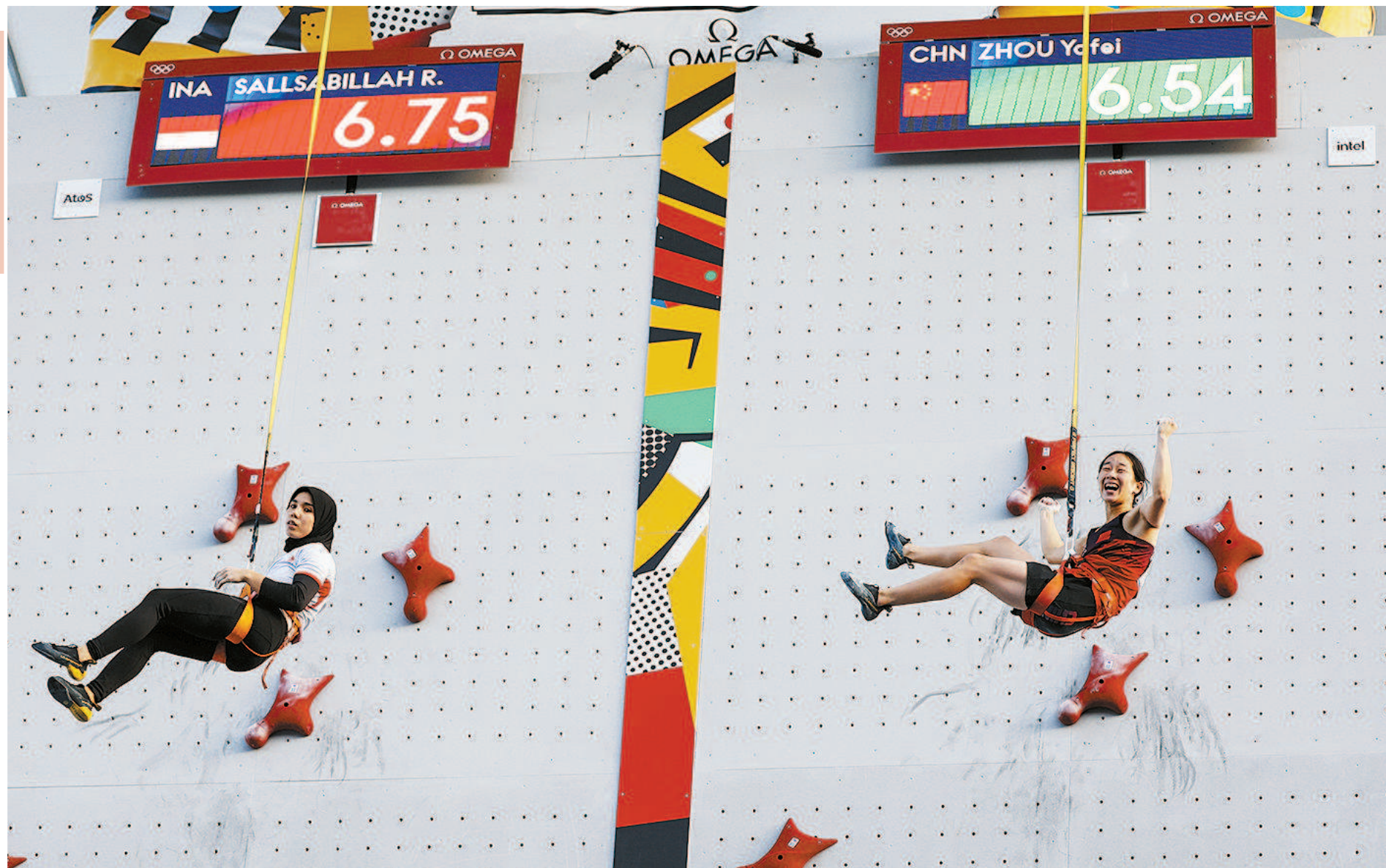
中国女子速度攀岩选手周娅菲(右)夺冠