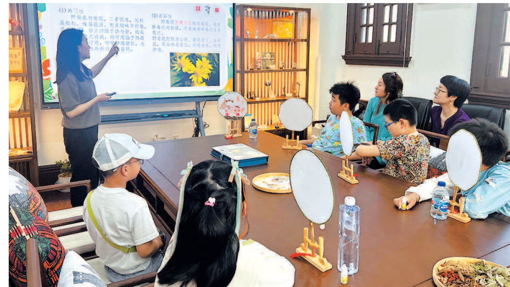
孩子们在中国医药博物馆了解中医科普知识