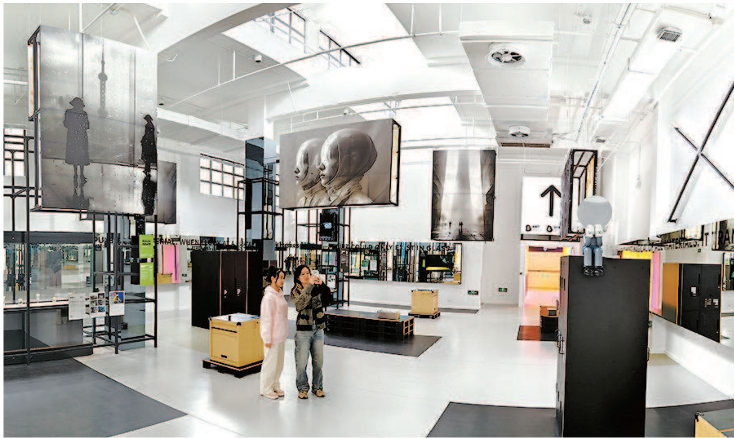
上海玻璃博物馆通过最新的虚拟现实技术和AI技术为参观者带来新颖的互动体验