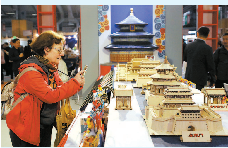
巴黎市民参观「遇见中国」中华文化主题展

早在巴黎圣母院烧损的2019年,当年11月中法双方就在北京签署合作文件,就巴黎圣母院修复开展合作,中国专家将参与巴