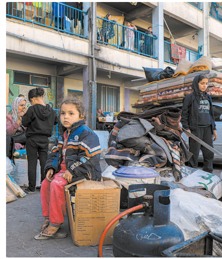
■ 巴勒斯坦人从拉法撤离

古特雷斯说,“我们正处在巴勒斯坦人民和以色列人民以及整个地区命运的决定性时刻”,以色列和哈马斯之间达成协议,对于结