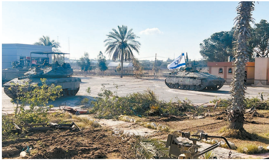
■ 以军坦克进入拉法口岸加沙一侧

以军在加沙地带由北向南发动地面攻势,目前有超过百万巴勒斯坦平民在加沙地带最南端城市拉法避难。过去数周以来,以色列威胁即将对拉法发起全面进攻,国际社会持续向以色列施压,埃及、卡塔尔等国加大力度斡旋停火。