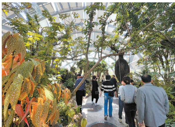
游客在上海植物园冷温室内参观

记者日前从上海植物园获悉,在上海(国际)花展举办之际,北区的山地植物馆和亚高山植物馆全新亮相,这也是上海首个“冷温室群”展馆。