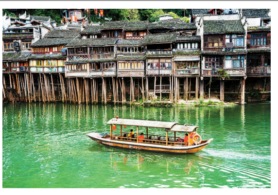
沱江泛舟

一个星期后,蒲公英的叶和花终于晒干了。我抓一把闻闻,浓郁的香气。我拿给十岁的元宝让他闻,“太香了!”