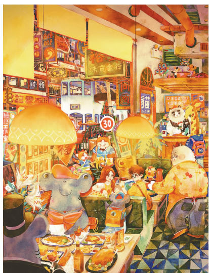
鱼鱼和桃桃作品《鱼鱼桃桃与猫猫》