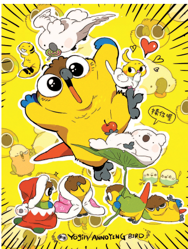
么了个著作《神烦鸟》