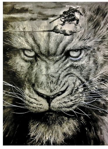
刘冬子作品《西游记·狮驼岭》