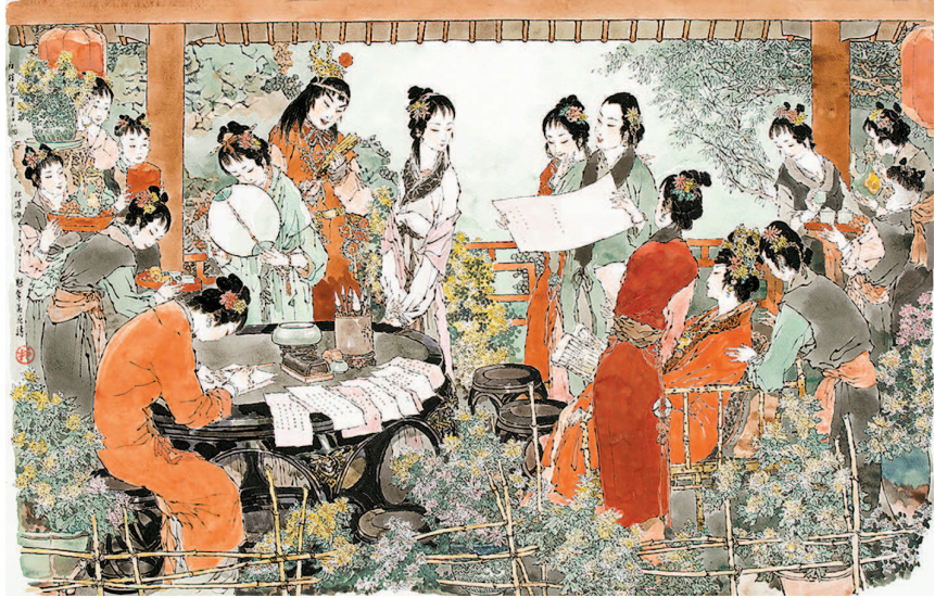
戴敦邦作品《红楼梦·菊花诗会》

节的一大看点。刘冬子的“西游”系列、阿梗的国风题材、甄子楷sheep创作的志怪宇宙以及昔酒的《铸剑》等作品,都是用插画的视觉语言对传统文化深挖、重塑后的现代表达,颇具创新价值。 本次艺术节还邀请了许多用插画艺术表达生活、传递温暖的优秀插画家展示他们的作品。对于追求合家欢的观众,艺术节还构建了一个回归童真的艺术乐园。 GAF插画艺术节萌芽于广州,生长在全国,今年以“柔软与拥抱”为主题。它不仅是一个艺术交流的平台,也力求成为年轻人玩在一起的欢乐节展。