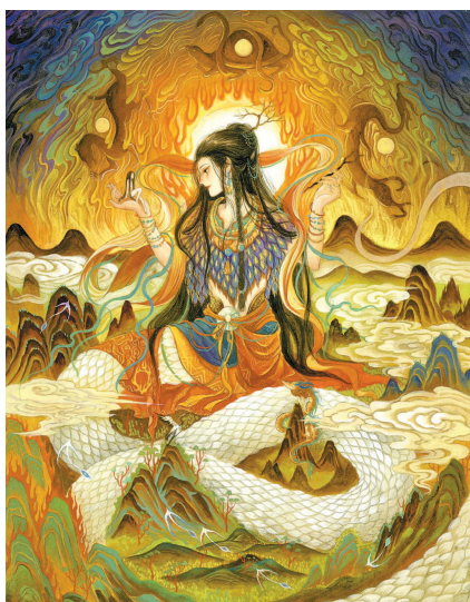
鹿溟山作品《中国神话》系列