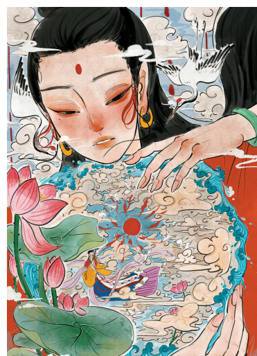
池蚂作品《仙人持宝镜》