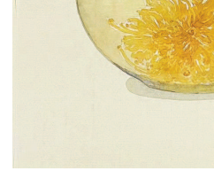
自得清意味 (中国画) 李知弥

听到他的话,我模糊了双眼,欣慰儿子十八岁,就能有这样的境界,让我欣慰又汗颜。人生的路艰辛漫长,我相信,他能走出自己的精彩。