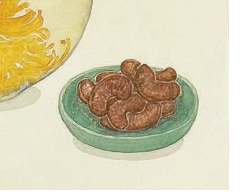
自得清意味 (中国画) 李知弥