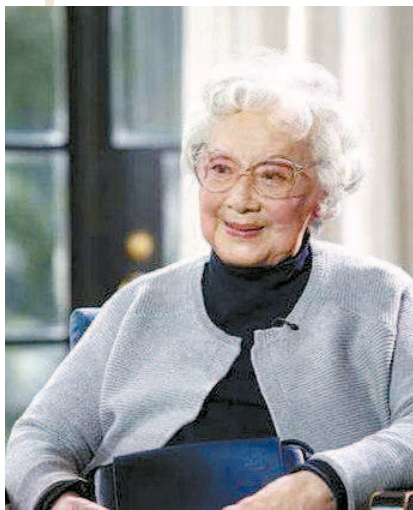
■ 晚年的王丹凤,岁月不败美人