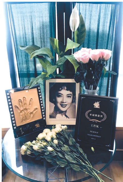
■ 上影剧团二楼一角

人生总有很多遗憾,这些遗憾无法弥补,但是我们之间的友谊、那些在一起的画面,那些彼此间的承诺,都会伴随着我们未来的人生和生活。任何一个演员,总会有一天离开舞台、离开银幕,但是我们心中的热爱,不会随着年龄而改变。就像我们敬爱的丹凤老师,她在我们心目中,永远是非常美丽的,会一直给予我们力量,给予我们温暖。