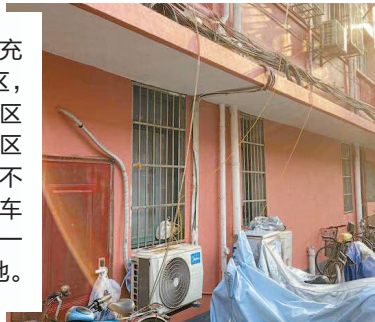
■小区内抬头可见“飞线充电”

居民小区和楼宇的电动自行车充电安全备受关注,但在一些老旧小区,违法充电问题依旧层出不穷。杨浦区控江路121弄多位居民反映,小区“飞线充电”险象丛生,多年来屡禁不绝、隐患重重,而新设置的电动自行车充电位不是被“鸠占鹊巢”,就只有一副“空壳”,陷入无法启用的尴尬境地。