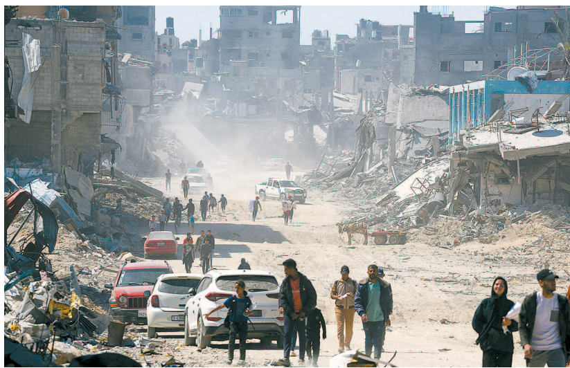
■以军撤出后的汗尤尼斯满目疮痍

以色列国防军最新发表的声明显示,自去年10月7日以来,以军杀死3万名哈马斯武装分子中的约1.3万人;113名哈马斯高级成员被杀,其中包括以军3月26日宣布击毙的哈马斯高官、卡桑旅副指挥伊萨。“以军已经不需要大部队驻守加沙地带,留下只会显得目标太大。撤出,是比加大投入更合适的选项。”李伟建表示,长达半年的战事令以色列