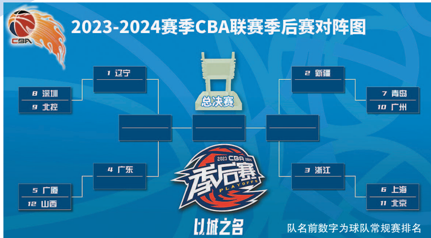
新民图表制图 叶聆

以城之名,“鲨”回季后赛!昨晚打完CBA常规赛最后一轮比赛,上海久事男篮主场以95比128不敌浙江队,最终以32胜20负的战绩排名第六,杀入季后赛并取得首轮的主场优势,首轮对手是北京队。如果能够淘汰对手,次轮将对阵常规赛第三的浙江稠州金租队。 根据规则,季后赛首轮采取三战二胜制,次轮采取五战三胜制,大鲨鱼首轮将拥有两个主场。常规赛中,大鲨鱼曾经和北京北汽队交锋两次,两队各胜一场。北京北汽队本赛季也受累于外援不力,这支老牌强队磕磕绊绊获得了季后赛资格,通过最后一轮客场战胜深圳马可波罗队,然后以相互胜负关系优势力压山