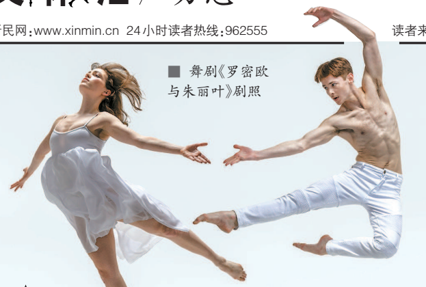
■ 舞剧《罗密欧与朱丽叶》剧照