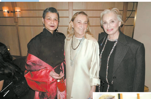
▲ 覃阿姨和Prada设计师缪西娅(中)的合影