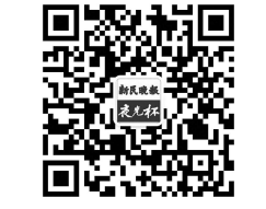
扫一扫，关注“夜光杯”

我的卧室和书房是在一起的。这就自然而然使得我每晚临睡前，都会不自觉地对面书橱的一排排书，多一些关注和凝视。久而久之，这些书便成了我居住其间最大的满足和慰藉。尽管有的书看过，有的还没有看过，但这不妨碍我对每一本书都感觉亲近和偏爱。