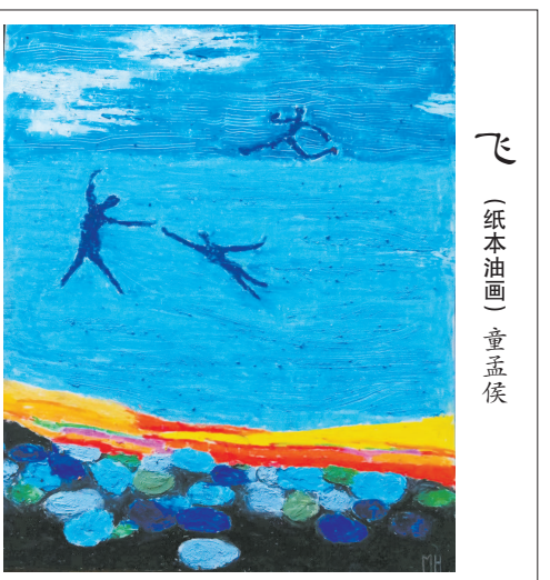
飞 (纸本油画) 童孟侯