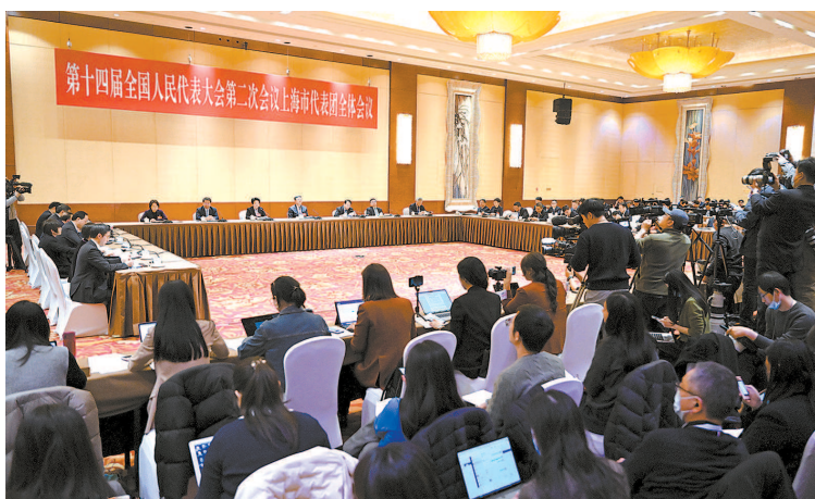
十四届全国人大二次会议上海代表团昨天下午举行全体会议,继续审议政府工作报告,并向境内外记者开放

审议政府工作报告 上海代表团举行全体会议, 更好激发经营主体 内生动力创新活力 陈吉宁龚正参加,黄莉新主持 百余位中外媒体记者到会采访