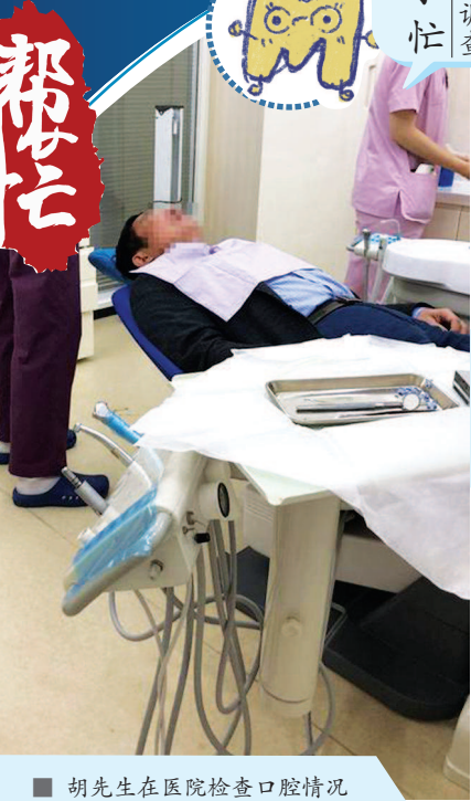
胡先生在医院检查口腔情况