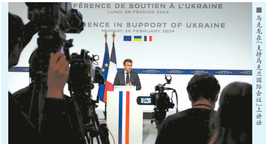
马克龙在「支持乌克兰国际会议」上讲话