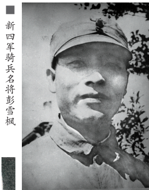
新四军骑兵名将彭雪枫

配备了雪枫刀的新四军骑兵团更是威震江淮。1942年夏,骑兵团将屏山、黑塔据点300多名抢粮的日伪军逼进开阔地,马刀纷飞,半个小时歼灭大部,余敌举手投降,夺回被抢的粮食。当年11月的反扫荡中,新四军主力跳到外线,攻击敌人簸箕窑据点,骑兵团第3大队从敌侧后猛袭日军,击毙日军小队长及翻译官等多人。新四军骑兵团与日伪军作战超百次,毙俘俘虏日伪军数百人,让日伪军闻风丧胆。 朱京斌