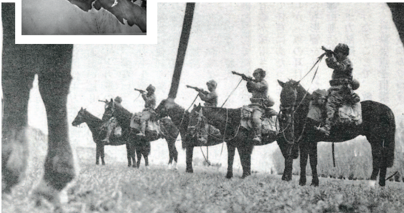
日军进行马上射击训练