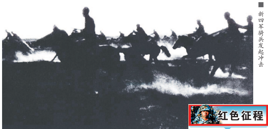
新四军骑兵发起冲击