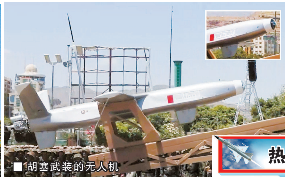
胡塞武装的无人机