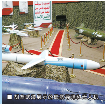
胡塞武装展示的巡航导弹和无人机