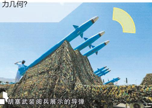
胡塞武装阅兵展示的导弹

2023年10月巴以冲突爆发后不久,雄踞也门北方的胡塞武装以“支持巴勒斯坦”为由卷入其中,不仅对以色列发射导弹,还在红海水域对任何“支持以色列的船只”发动攻击。美国旋即对胡塞展开空袭,今年1月17日将其重新列为“特别指定的全球恐怖组织”。但胡塞不以为意,其发言人叶海亚·萨雷亚声言要切断红海通信光缆,“让西方回到石器时代”。人们不禁好奇,这支敢于正面“硬刚”美国的胡塞武装是什么来头,战力几何?