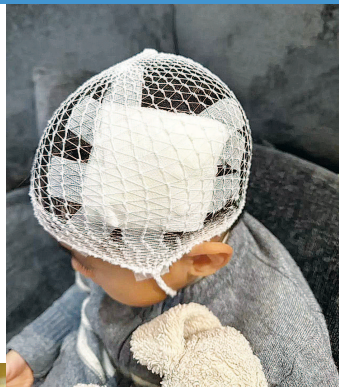
孩子头部撞破一道口子,缝了一针