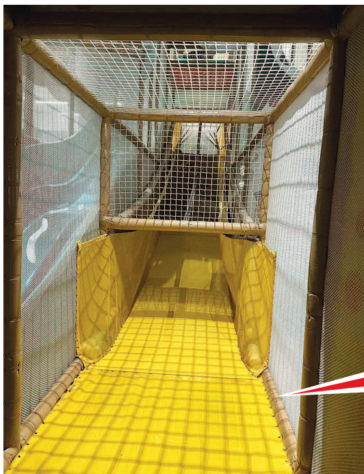
奈尔宝长泰广场店滑梯包边至平坡段处就没有了