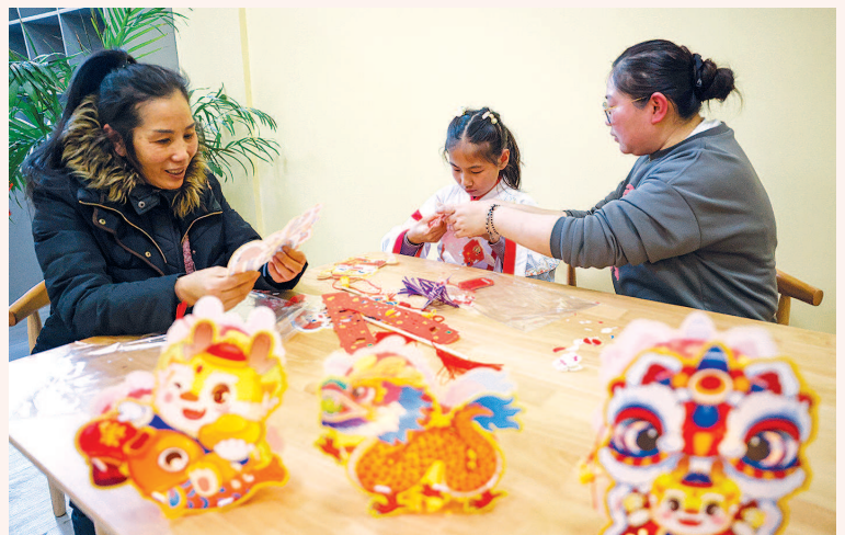
社区龙「武」国风喜气扬

5. 遇到火情 ，应通过就近的疏散通道快速逃生，不贪恋财物、不乘坐电梯、不盲目跳楼；同时，及时拨打119火警电话，报警时要讲清楚地址、起火部位、是否有人被困等信息。 本报记者 潘高峰