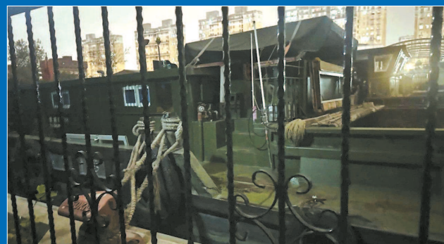
■ 船上环境凌乱不堪