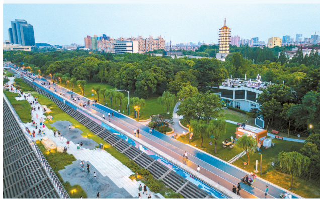
■ 宝山滨江新时代文明实践公园成为市民休闲好去处

近年来,宝山创新实施文明实践“传帮带”工程,以文明实践“充电宝”行动为载体,推动文明实践中心建设高质量可持续发展。去年,“一星一益”“星”系列文明实践项目破茧而出,让创新、有爱的文明实践活动更好地服务群众、引领群众、凝聚群众。