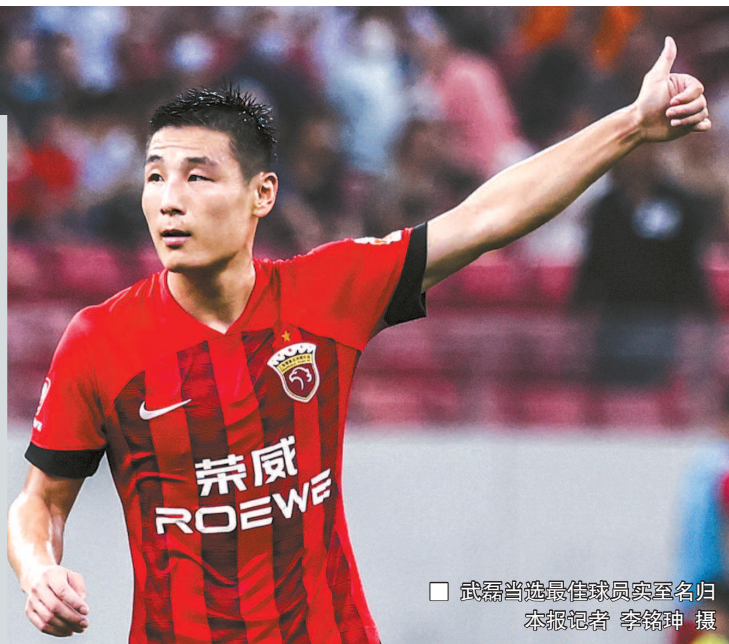
□ 武磊当选最佳球员实至名归

昨天，中超联赛组委会公布了2023赛季中超联赛年度奖项评选结果，在最受关注的几大评选中，上海海港队的国脚武磊当选年度最佳球员、浙江队外援莱昂纳多当选年度最佳射手、山东泰山队韩国籍主帅崔康熙当选年度最佳教练员、泰山队门将王大雷当选年度最佳守门员。