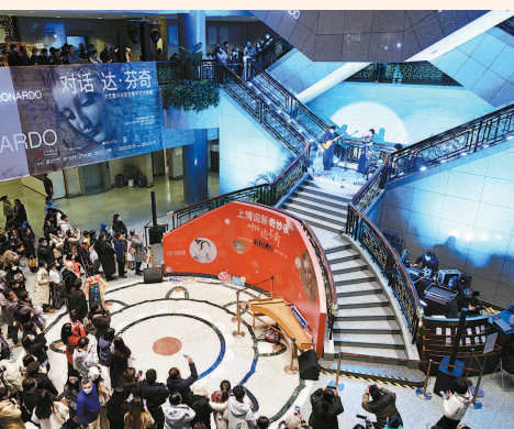
▲上博“对话达·芬奇——迎新奇妙夜” ▲龙华古寺狮龙齐舞

到放松和温暖,而“分娩镇痛”更让她轻松不少。对于“糯糯”的到来,刘女士说一家人期盼已久:“我觉得她是一个很有福气的宝宝,之前就期待她能在新年第一天出生,果然好运连连。希望未来她能平安健康。”记者获悉,截至今天上午8时,上海市第一妇婴保健院东西两院共迎来9名“元旦宝宝”。0时15分,26岁的小米(化名)在上海红房子医院经剖宫产分娩了一名女婴,体重3320克。小米和丈夫小胡都是来自山东临沂的新上海人,小米怀孕41.5周才分娩,所以给女儿起名“晚晚”。“尽管来得晚,但是赶着元旦这天,来得讨喜,希望她今后健康康、平平安安。”小米说。截至今天上午9时,红房子医院共迎来5名元旦宝宝。