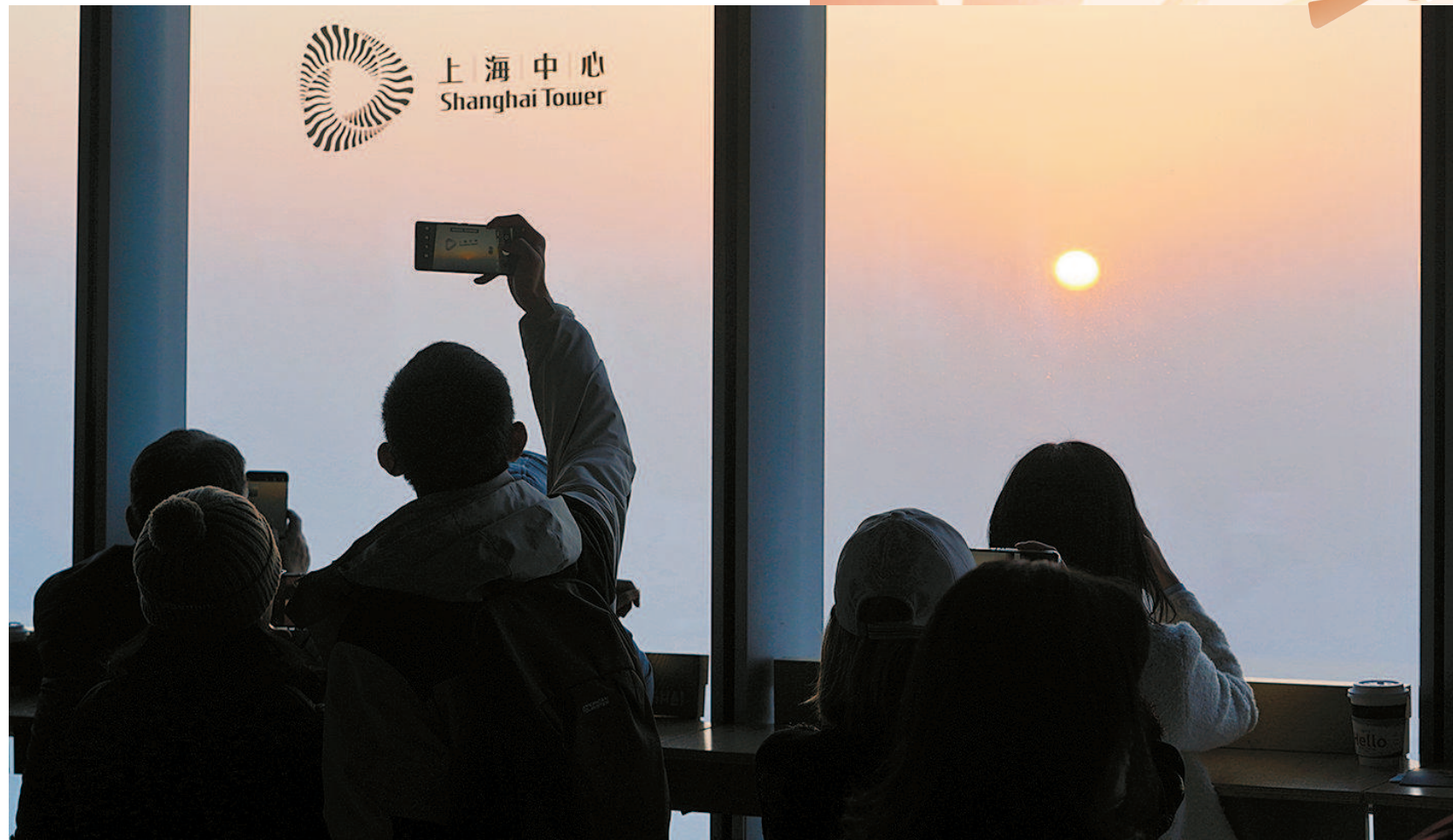
市民游客在上海中心(左)和金山海边(右)迎接新年第一缕阳光