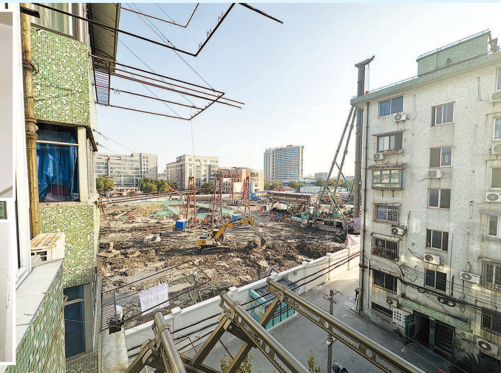
■ 小区与工地仅一墙之隔