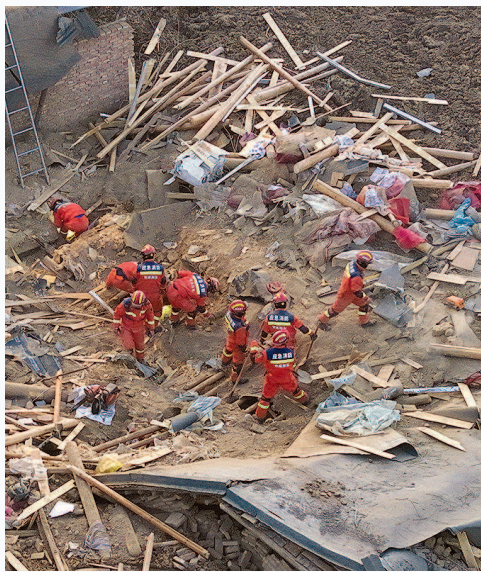
■ 地震灾区首夜目击

根据习近平指示和李强要求,国务院已派出工作组赶赴灾区指导救援处置等工作。甘肃、青海已组织力量开展抢险救援,并紧急调拨帐篷、折叠床、棉被等救灾物资运抵灾区,全力做好受灾群众救助。目前抗震救灾各项工作正在紧张有序进行。