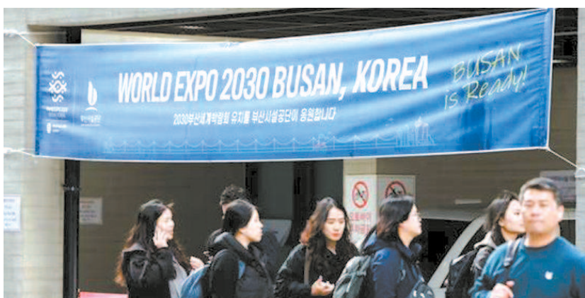
釜山街头随处可见申博宣传