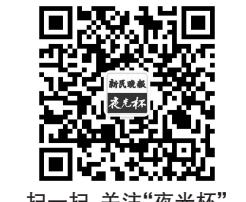
扫一扫,关注“夜光杯”

听广播丰富了日常生活,也见证了家和国家的发展变化。整理旧物,就数半导体收音机多,抽屉里大大小小七八只,想送掉几只没人要。熟人说原装的旧先鋒落地音响丢在外面都不看一眼呢。世界变化快是因为科技发展快,手机早有了收音机功能。我用手机听广播,电台正在播报神舟十七号和十六号飞船“一上一下”的新闻;耳边似乎听到呼呼作响的风声,那是时代的高铁飞驰向前。