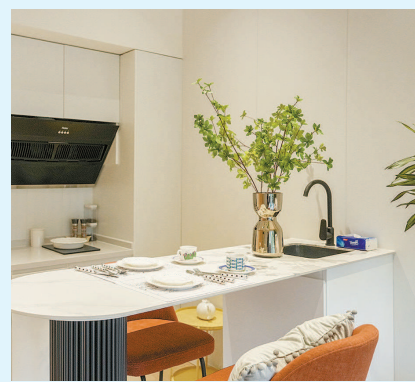
■ 公寓房拎包入住,社区内有书局,还有会客厅,年轻人看书聊天,安居乐业