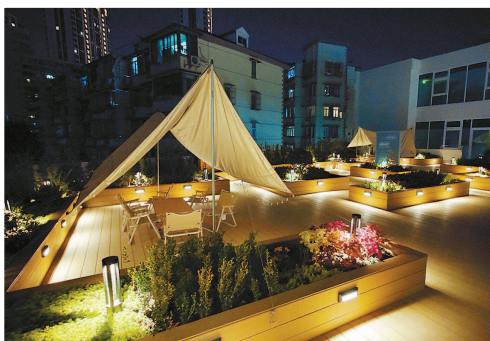
▲ 公寓的屋顶花园在夜晚成为一道风景

一周来,在入住的文化人才眼中,家的感觉是怎样的?他们的生活因为这栋公寓发生了怎样的改变?