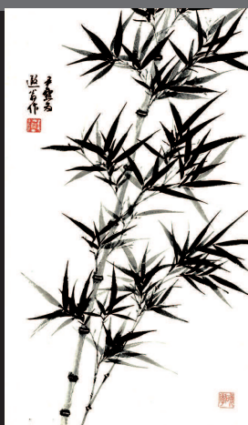
■ 为叶恭綽绘墨竹 纸本 约20世纪40年代

人相與議論亦間居 至樂也某庸懦自畫 兄所素知每思向來 琢磨之言他人誰肯 如此今不加勉日遲 一日遂將為庸人以 老徒自慚懼廬陵過 從極少幸南豐兄未 赴官可請益耳其他 非會面握手莫能盡 一味馳仰元晦一 是晚輩喜假其說輕 試而妄用