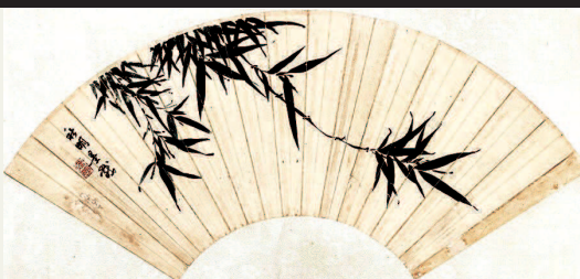
■ 墨竹图 笺本 约20世纪30年代

史君覽後部史仇誦縣吏 對君等補完里中道之 在唐垣西壞決里外塗色 通大溝吏深民侵擾注城 池恐縣吏池道深民侵擾 所自以民錢林道深民侵擾 令百姓還