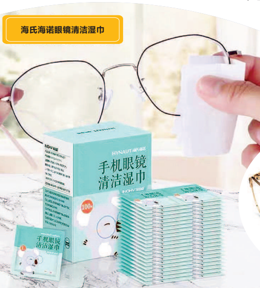
海氏海诺眼镜清洁湿巾