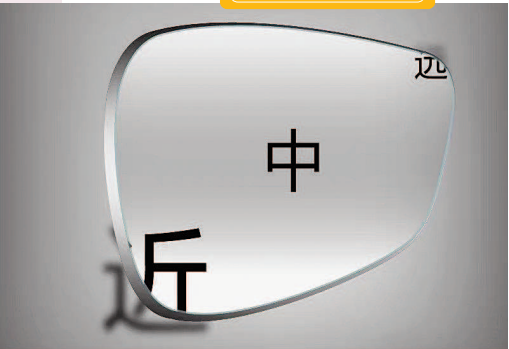
依视路自由渐进片

有些中老年人还存在畏光的情况，那么给镜片增加变色功能也很实用。当户外阳光比较强烈的时候，镜片自动变色，就能让眼睛更加舒适，也不会受到紫外线的侵害。